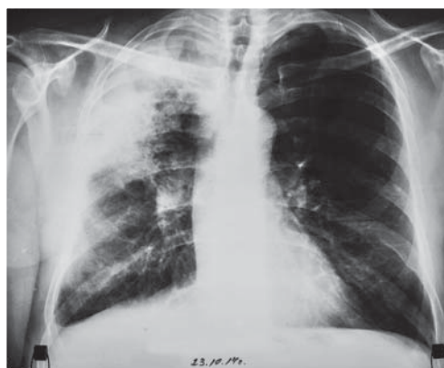
Рисунок 2. Рентгенограмма органов грудной клетки пациента В (23.10.2014 г.).