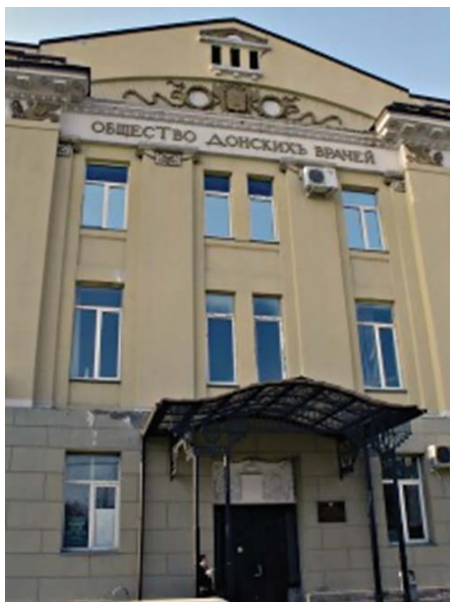
Рисунок 1. На фасаде здания по центру надпись: «Общество Донских врачей». Над ней — символ атаманской власти «пернач», а еще выше — герб Российской Империи. (В настоящее время в отреставрированном и модернизированном здании располагается больница скорой медицинской помощи г. Новочеркасска).

Общество существовало на благотворительные средства и членские взносы. Первыми крупными пожертвованиями был дом и земли генерала Платона